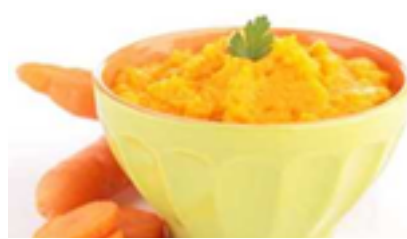
vogelnestjes met wortelpuree