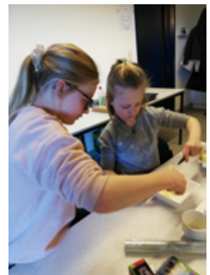
Koken voor kinderen - 23 dec. 2019