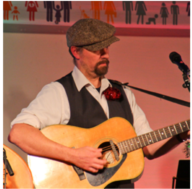
21 december 2019