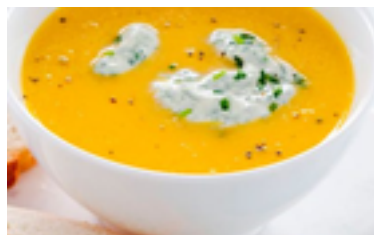
gele paprikasoep met mascarpone